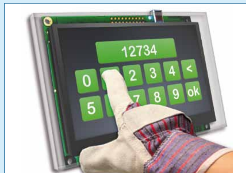
Figuur 2. Eén van de displays uit de smart TFT range van Itron.