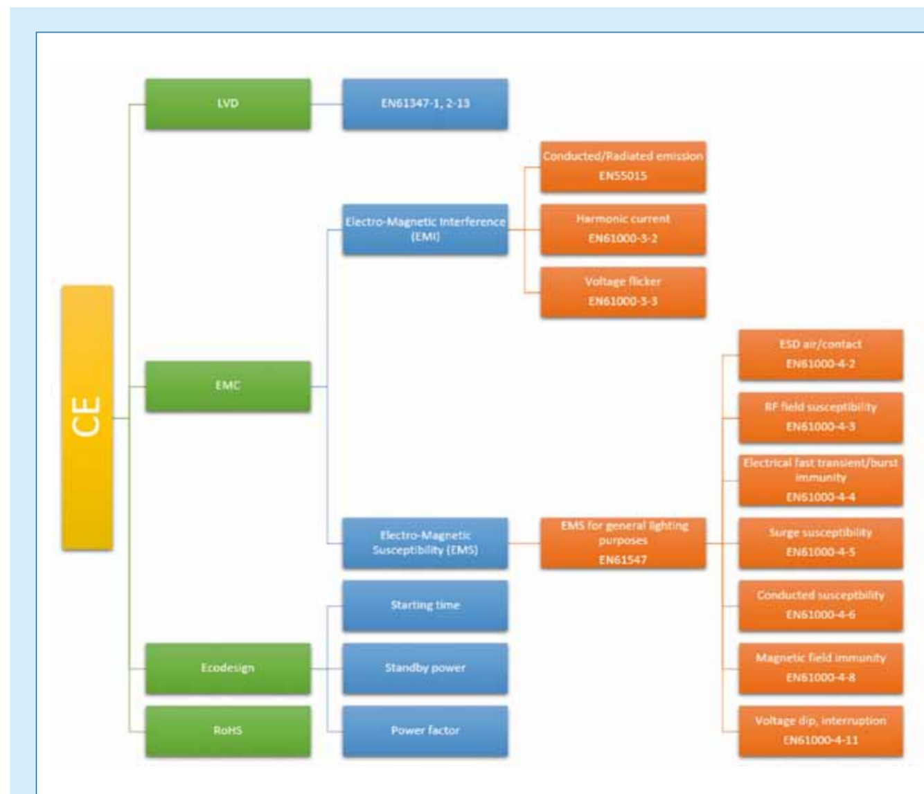
Figuur 1. CE eisen voor LED-driver of aansturing.