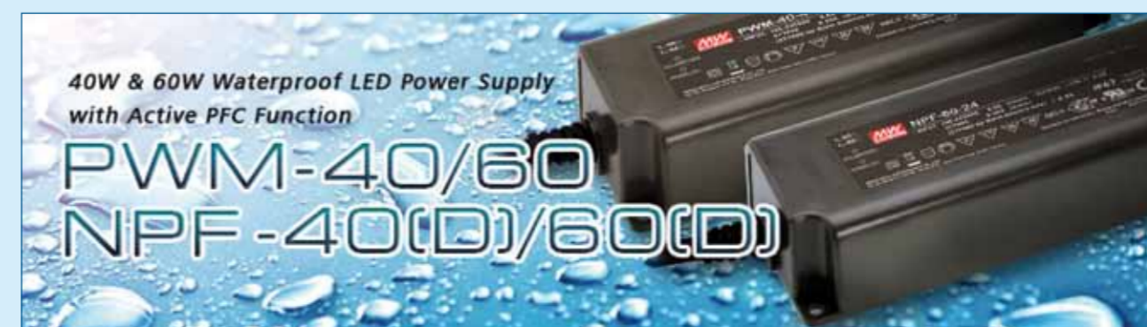
Figuur 3. De NPF-40(D)/60(D) en PWM-40/60 series van Mean Well voldoen aan de normen voor CE-markering.