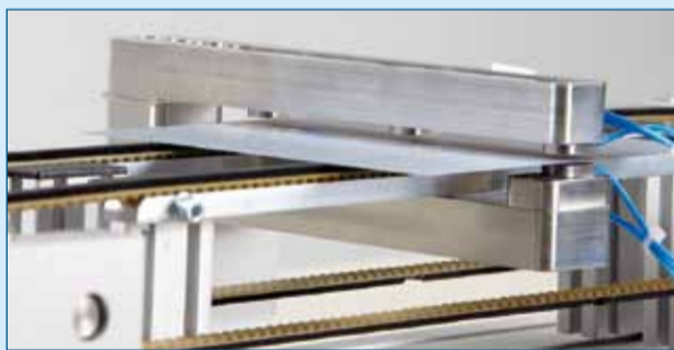
Figuur 2. De meetopstelling voor het meten van de waver-dikte.