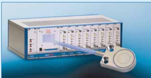
Figuur 4. Voor meerdere sensoren die via Ethernet zijn uit te lezen, heeft Micro-Epsilon een compleet systeem uitgebracht.